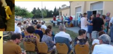
MARSANNE JUIN 2017