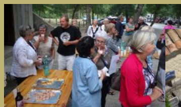
ALBA JUIN 2014

Diplômée des Beaux-Arts de Saint-Etienne, elle a travaillé entre autre comme conférencière au Musée des Tissus et Musée des Arts décoratifs de Lyon. Passionnée par le Japon, elle propose de nous initier au Katagami, une technique qui permet d'imprimer et de teindre les tissus à l'aide de pochoirs.