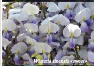
Wisteria sinensis «sweet»